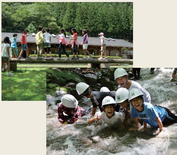
中津川県有林「学習の森」