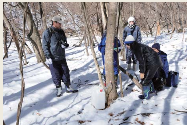
中津川県有林における樹液調査