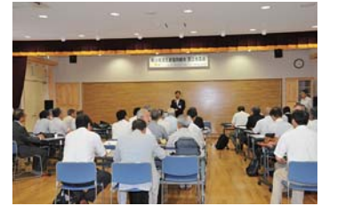
森林・林業関係者多数が参加した設立披露会 (2012年7月17日秩父市影森公民館)