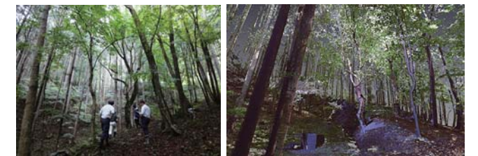
3Dスキャナによるカエデのデータ取得例 (左：イタヤカエデ写真画像、右：3Dスキャナによるデジタル画像)

カエデの1本ごとの位置情報、直径や樹高といった個体情報、毎年の樹液産出量、ユーザ情報などさまざまな情報の整備によって、身近にカエデの森林を把握することができるようになります。例えば、樹木の里親制度のようにユーザと組合が協力して、カエデの森を管理し、活用していくことができます。